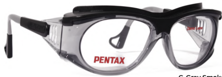
C. Gray Smoke