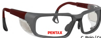
C. Rojo / Gris